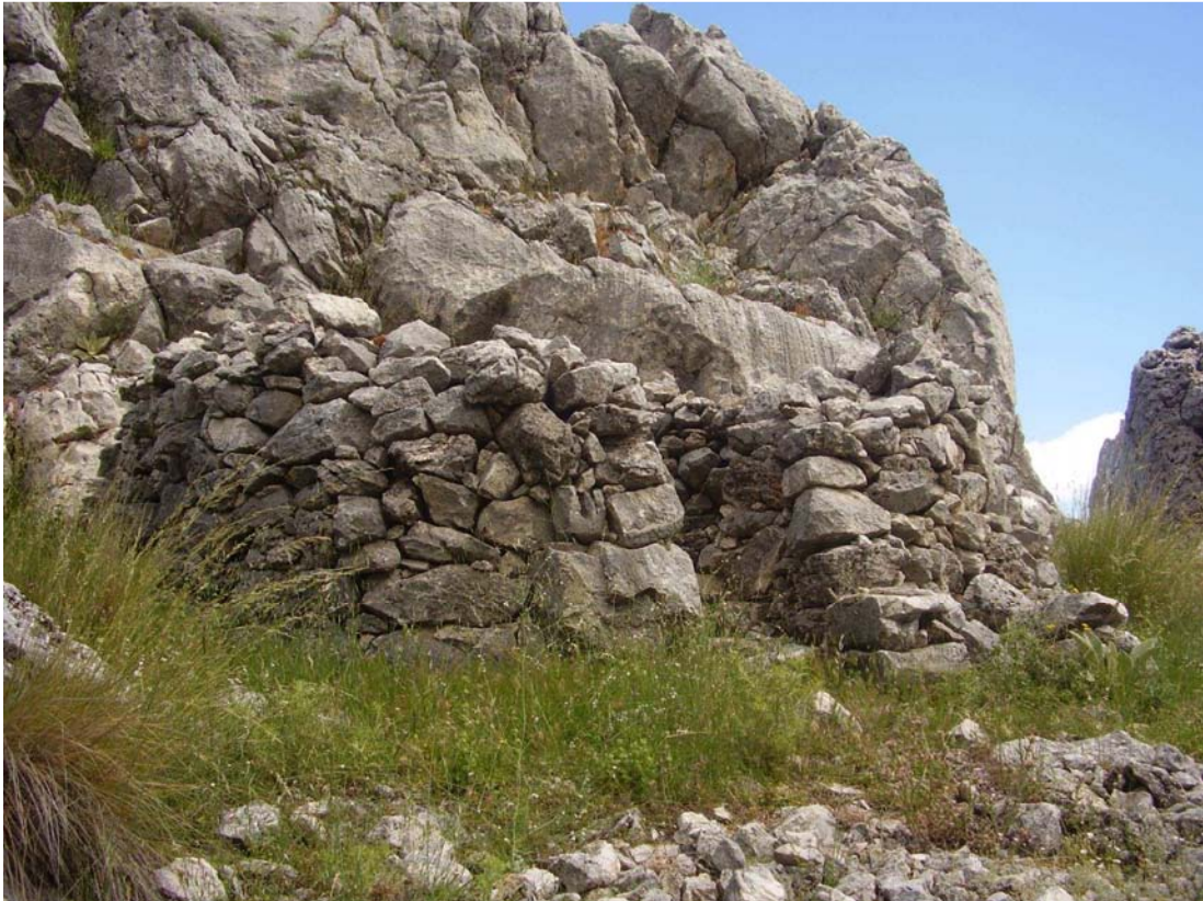
Vista general del rancho de las Hoyas