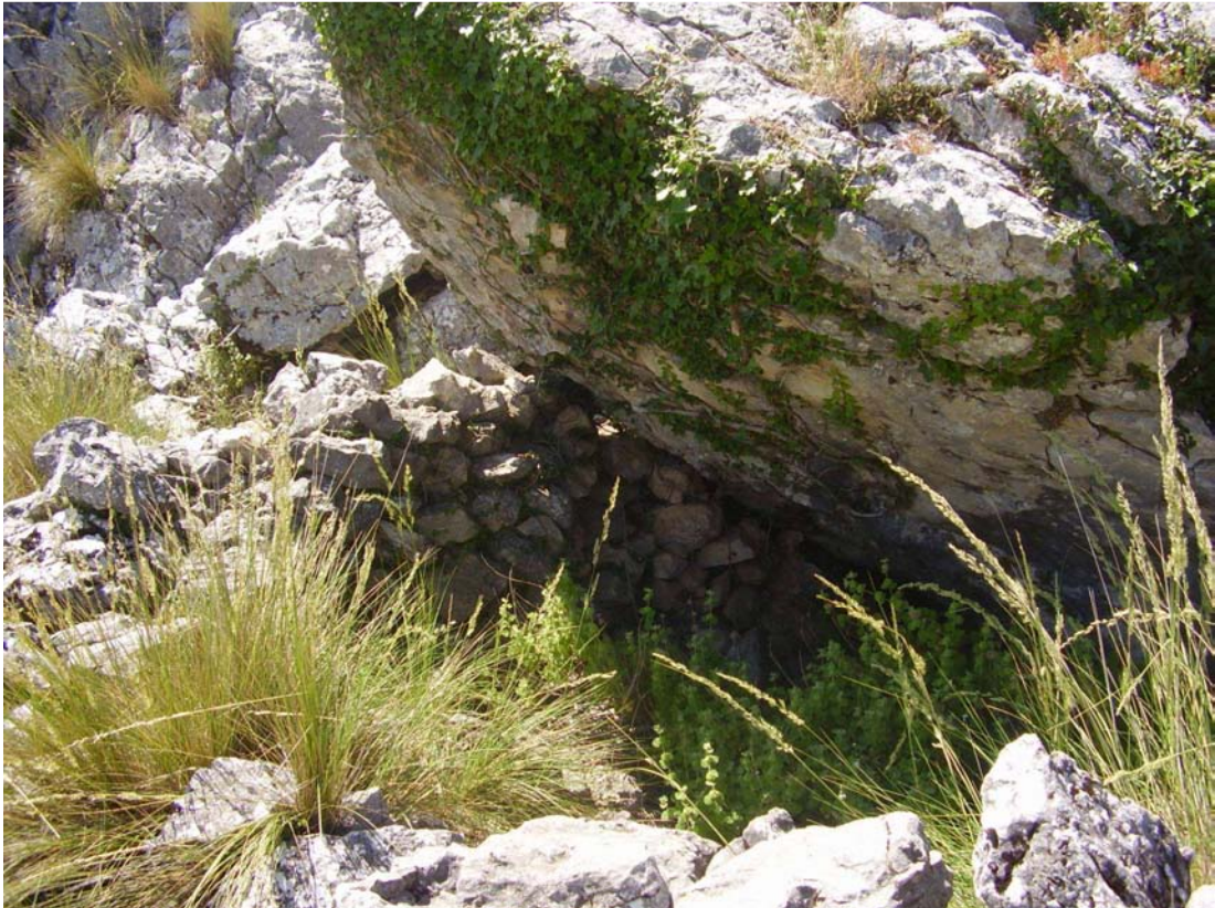
Vista de la covacha de las Yedras