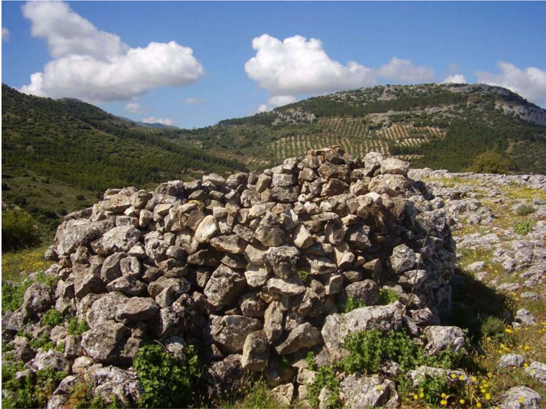
Vista frontal del rancho del Cerrillo del Orado