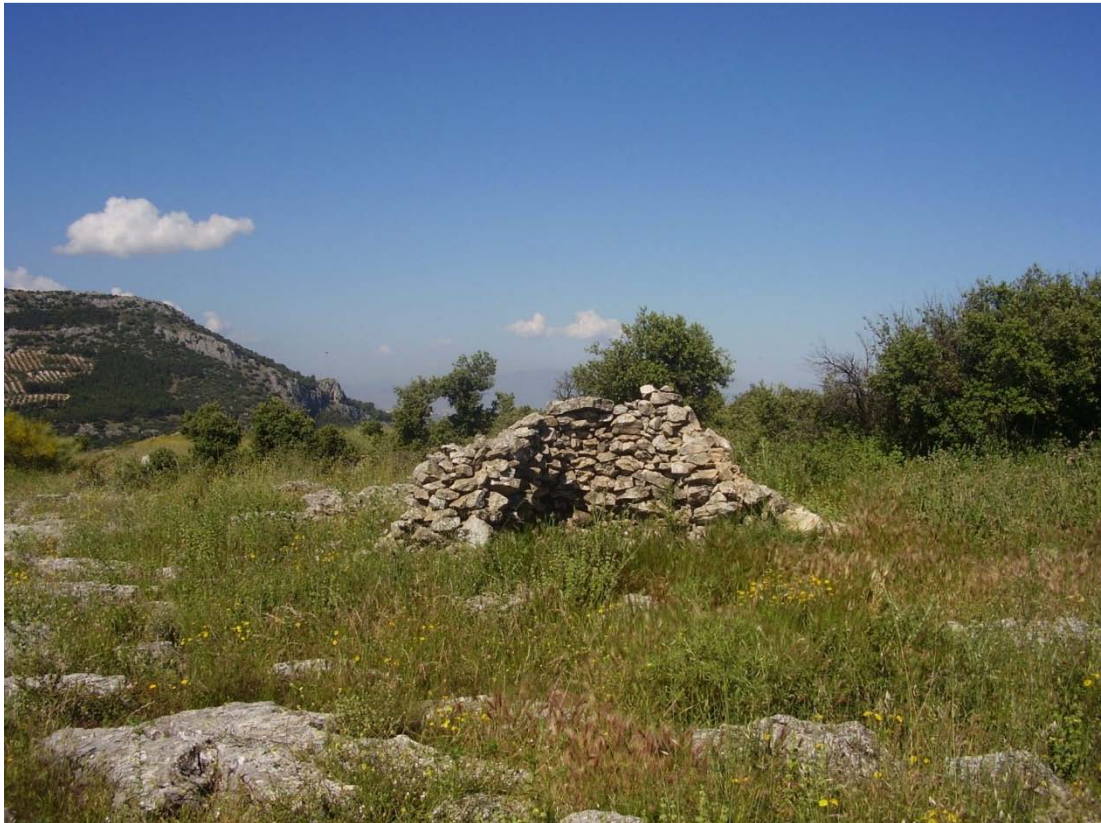
Vista del rancho ubicado en el paraje del Llano de la Cruz