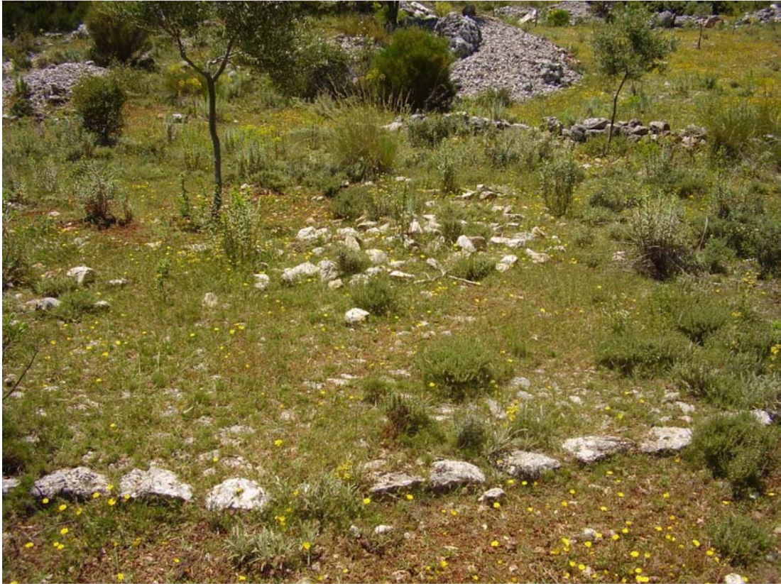
Vista de la Era de Hoyo Majano