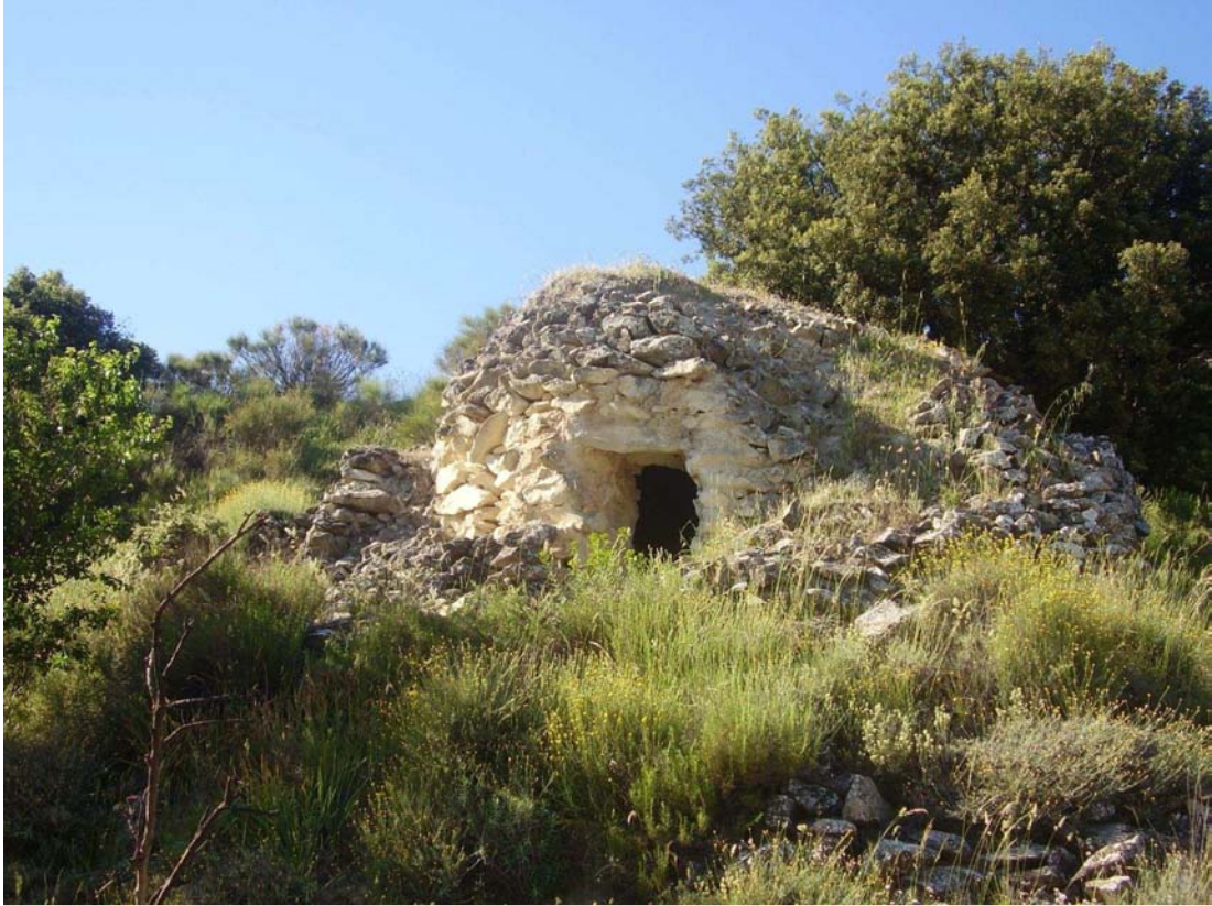
Vistas del caracol de Cerdicas