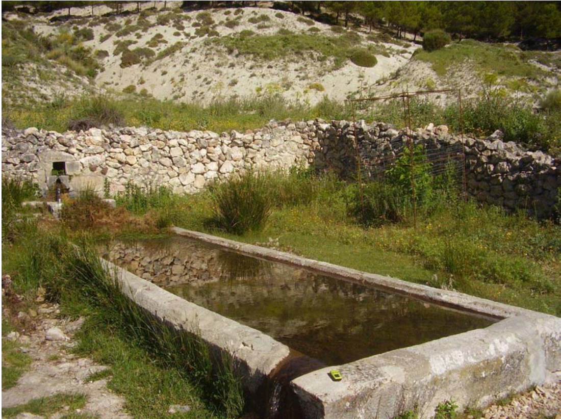
Pilar y albarrada de la Fuente del Moro