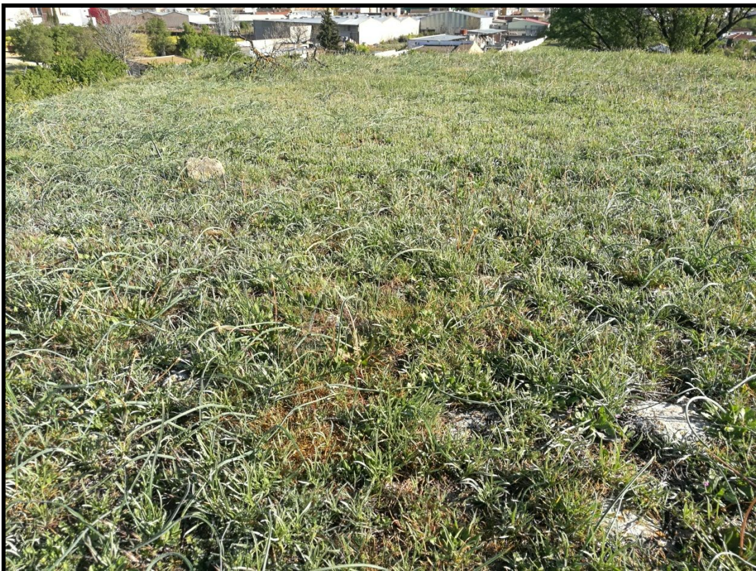
Vista detalle del estado actual de la construcción.