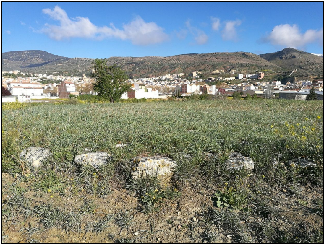
Vista detalle de la piedra utilizada en el borde de la construcción.