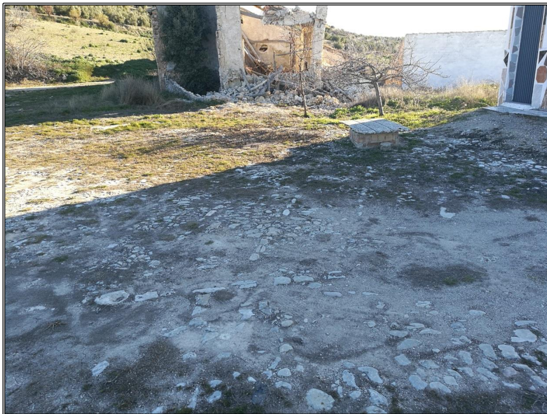
Detalle del empedrado de la era. Se aprecian las líneas maestras.