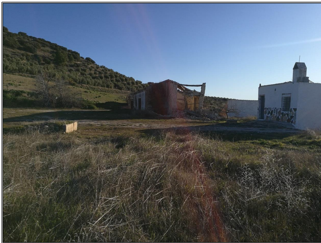
Vista general de la era. Se aprecian las naves agrícolas y caseta construida sobre la era.