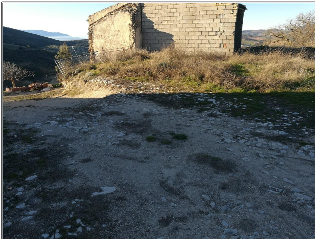
Detalle de la parte de era destruida tras la apertura del carril.