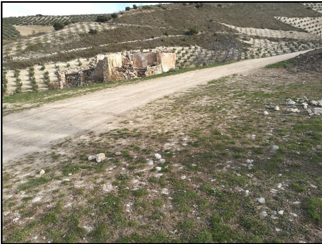
ERA 2. Detalle empedrado de la era. Cortijo ubicado al Noreste de ésta.