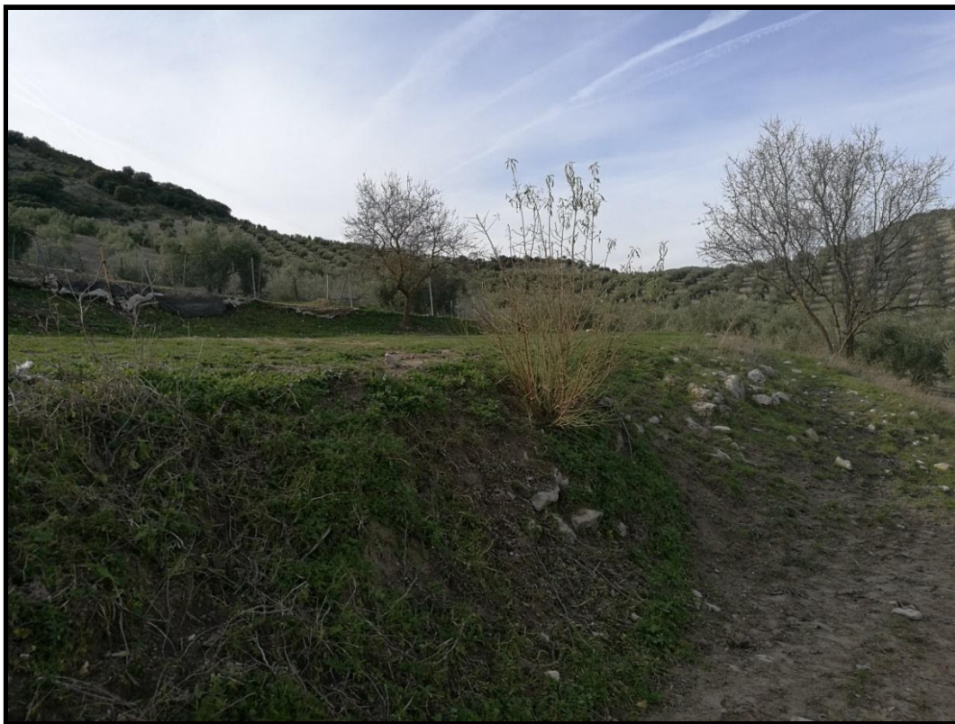
ERA 2. Detalle del talud Norte.