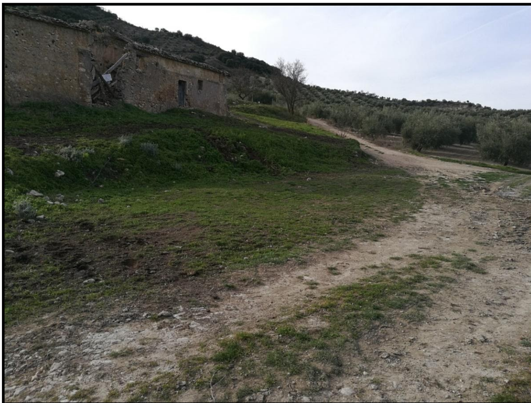
ERA 1. Vista general de la era. Se aprecia el cortijo ubicado al Sur de la era.