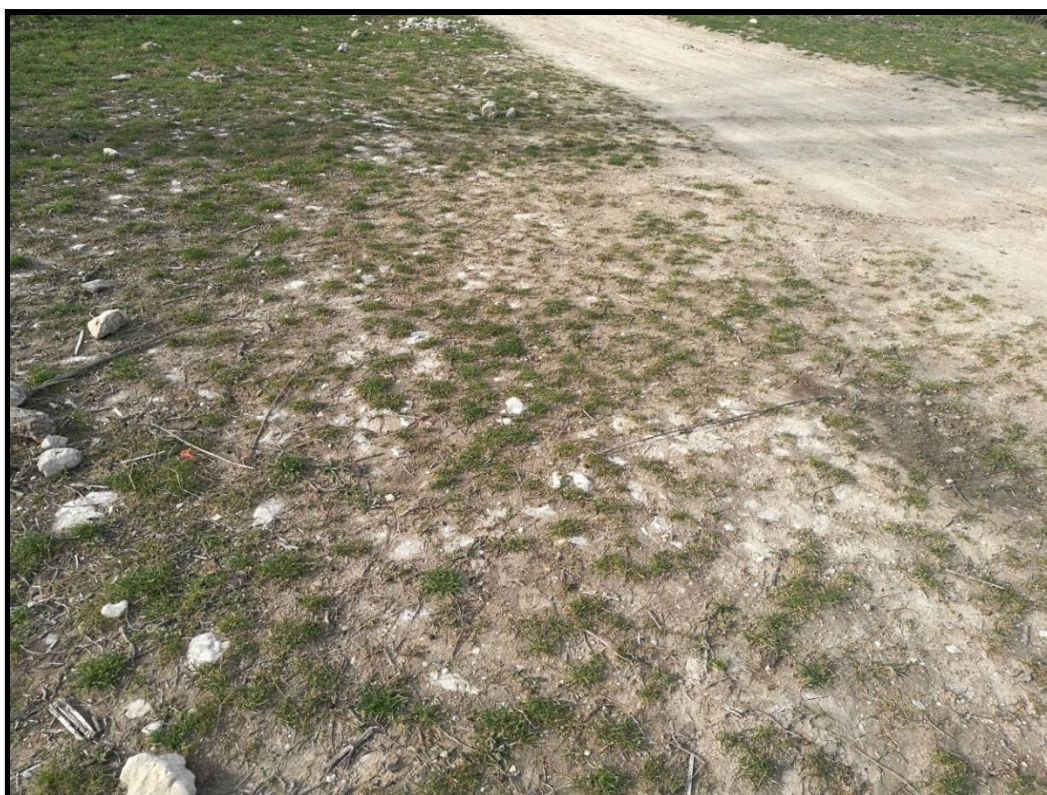
ERA 1. Detalle del empedrado de la era.