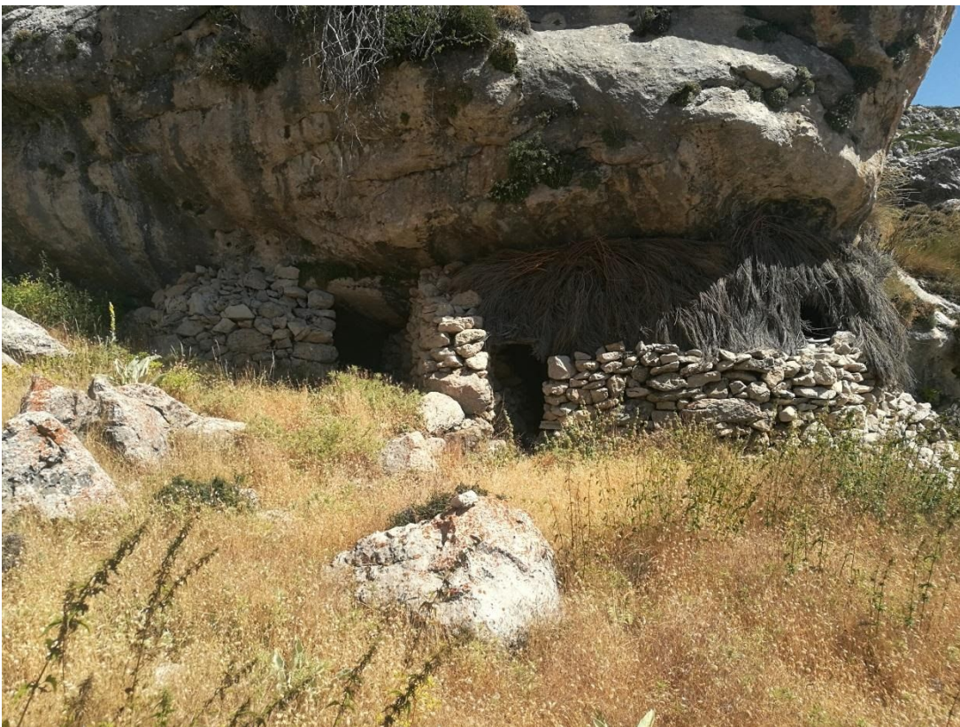
Vista del exterior de las Chozas 1 y 2.