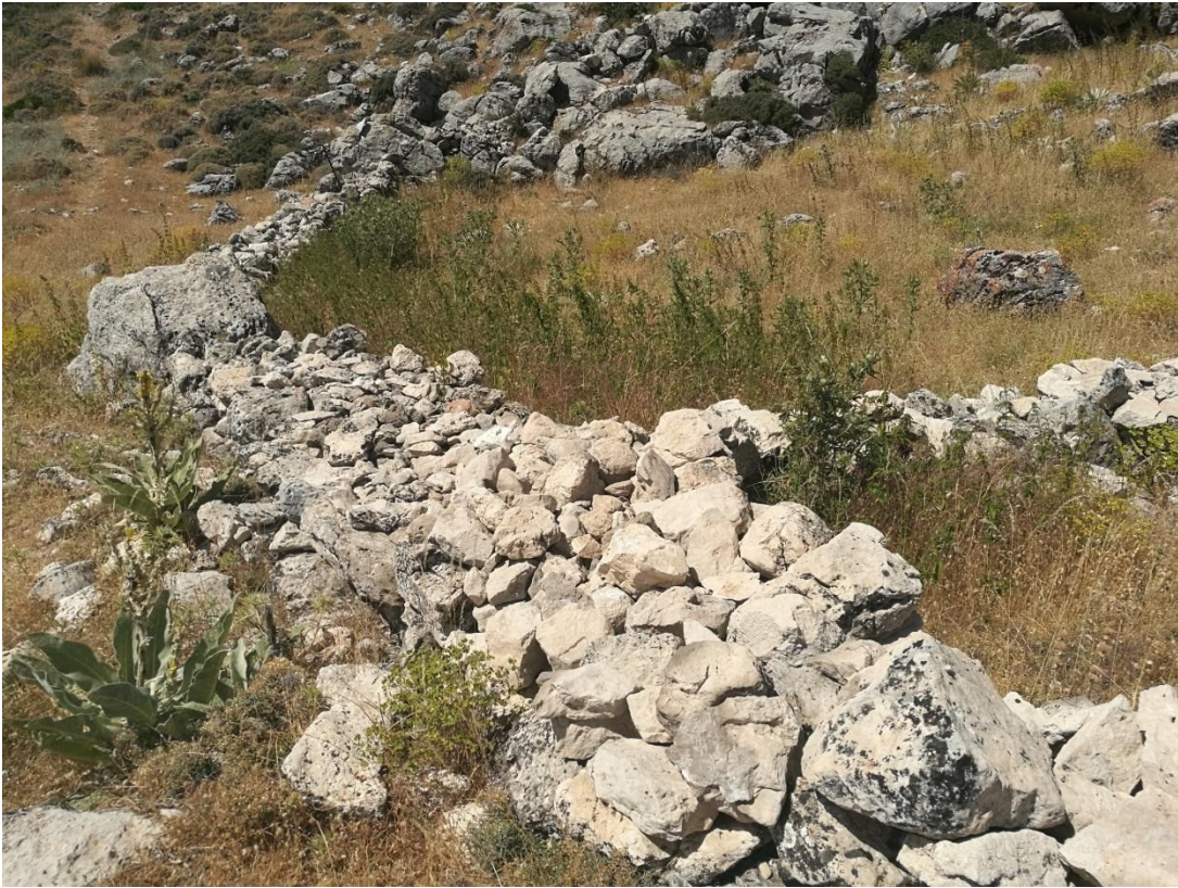
Detalle de los muros de piedra seca que culminan los cerramientos de los corrales 1 y 2.