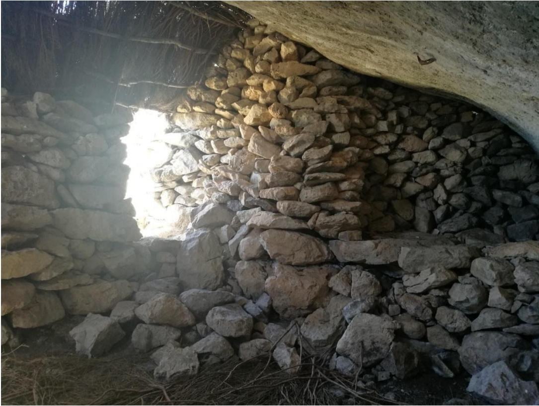
Detalle del interior del habitáculo de la choza 2. Alacena y puerta de entrada.