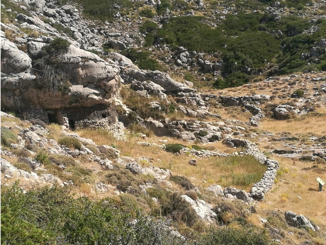
Vista panorámica del conjunto.