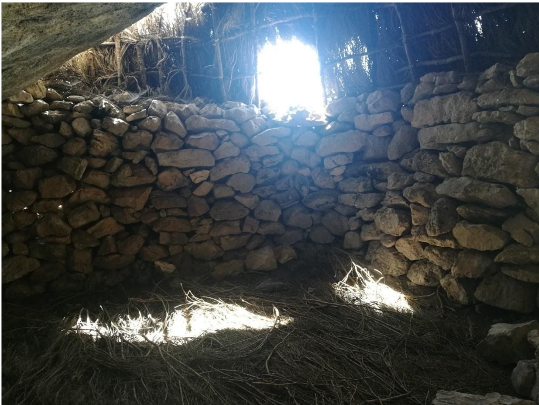
Detalle del interior del habitáculo de la choza 2. Muro y vegetación que forman el cerramiento.