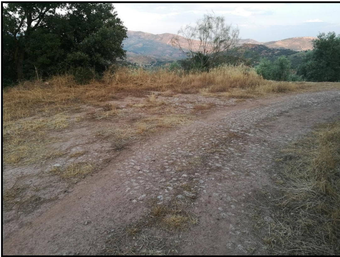
Vista parcial de la construcción.