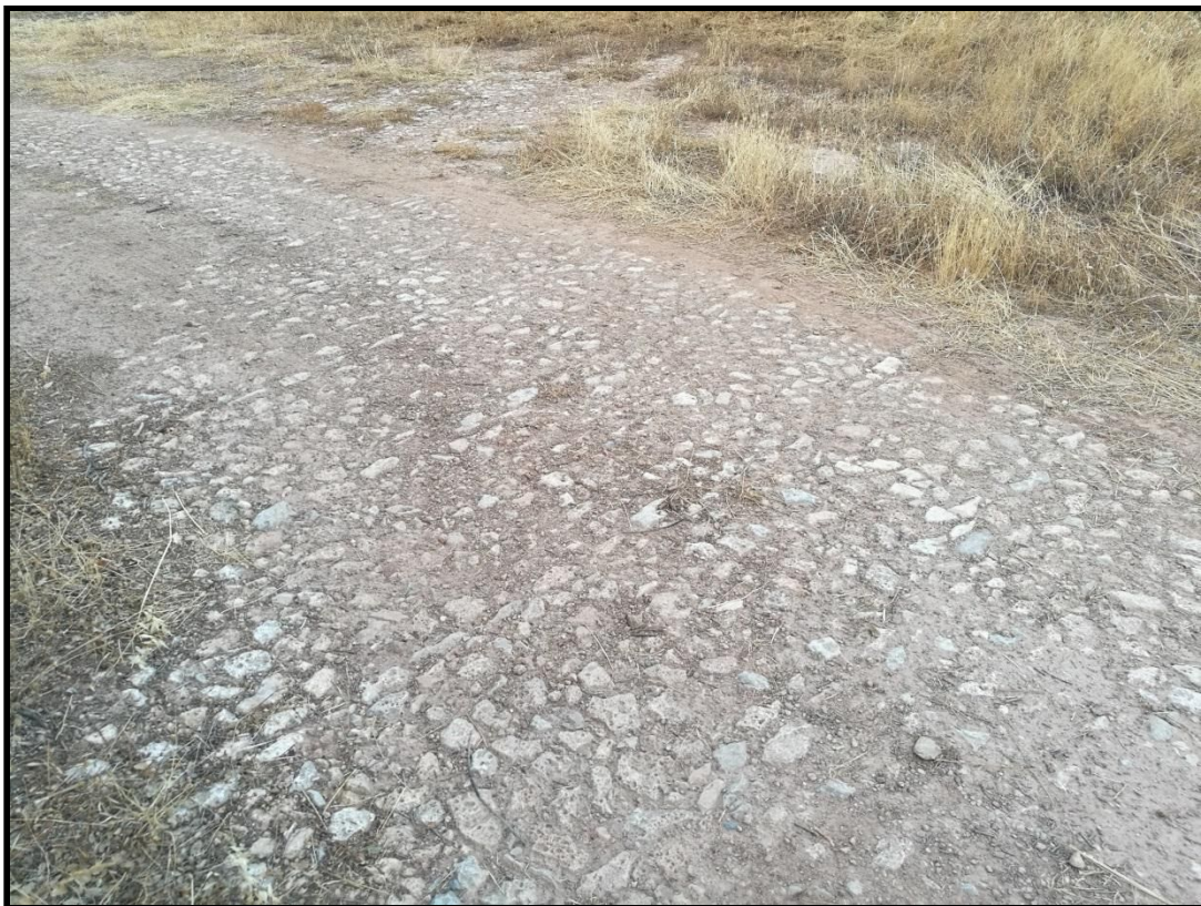
Detalle del empedrado y estructura de piedras guía de la era.