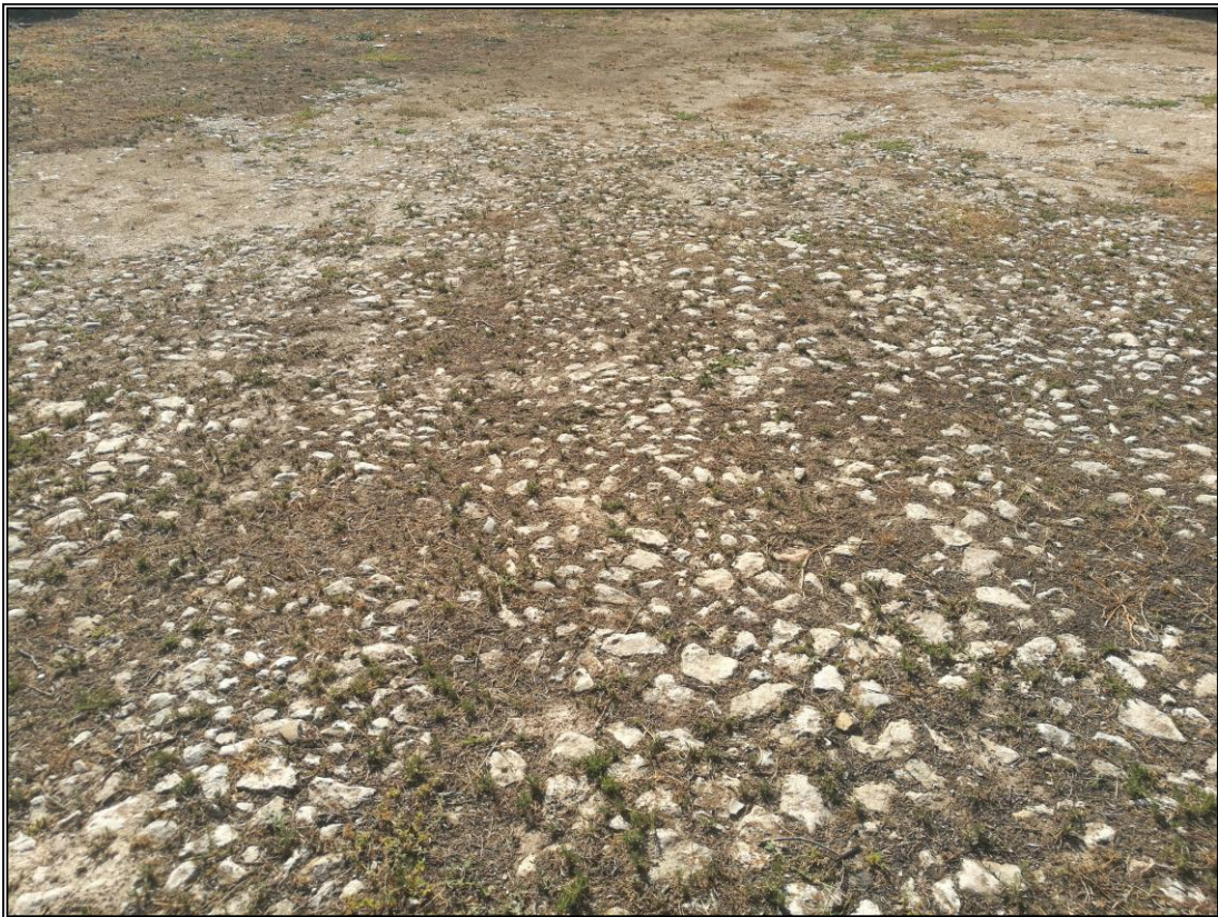
Era 1. Detalle del empedrado. Se aprecia una estructura en forma de estrella.