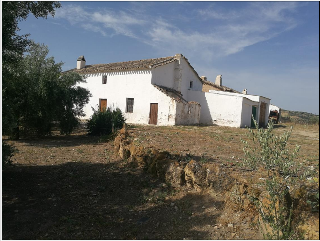
Era 1. Vista del lateral Este. Realizado con una hilera de grandes piedras.