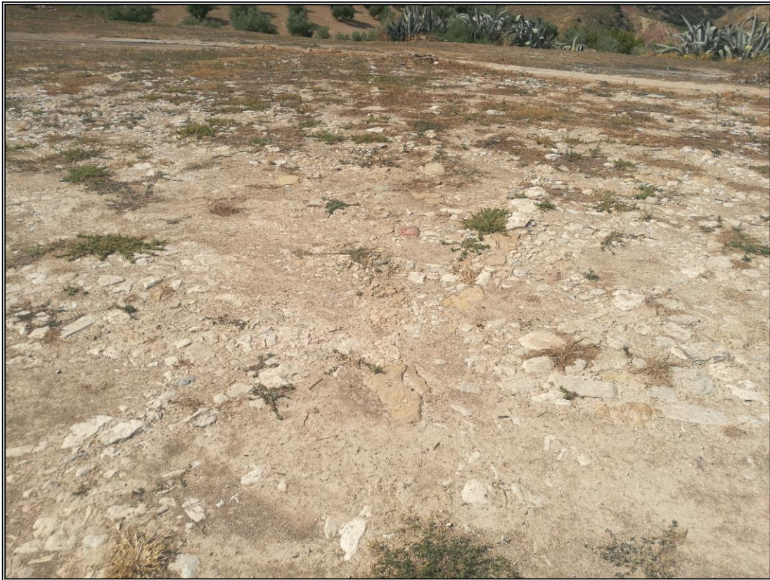
Era 2. Detalle del empedrado. Se aprecia una estructura en forma de estrella.