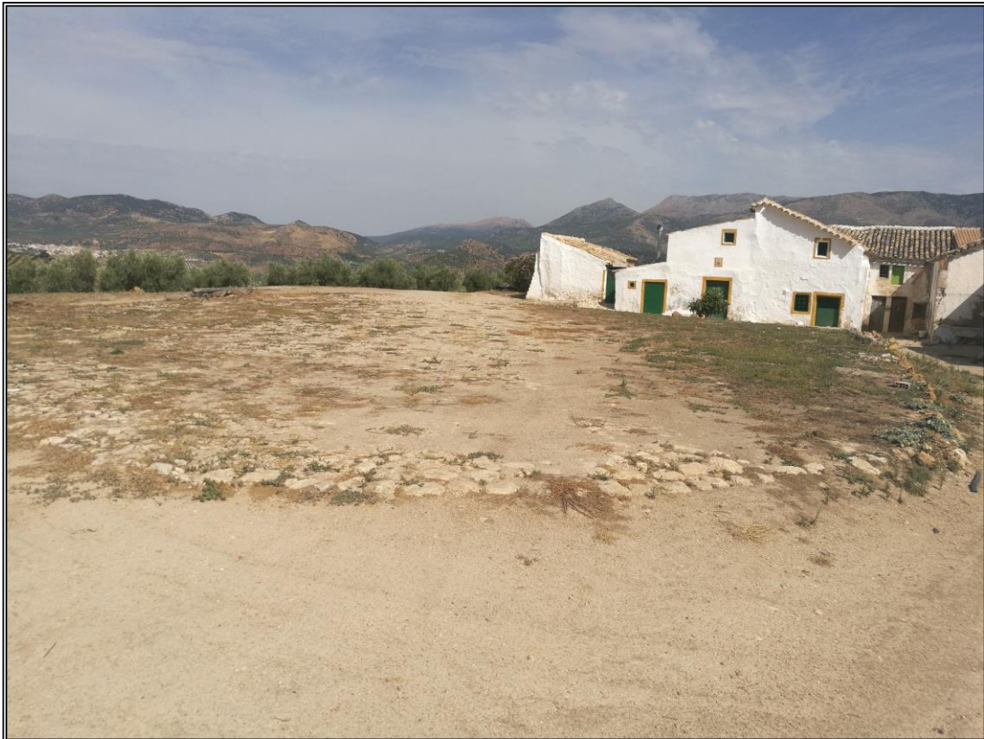
Era 2. Vista general de la era.