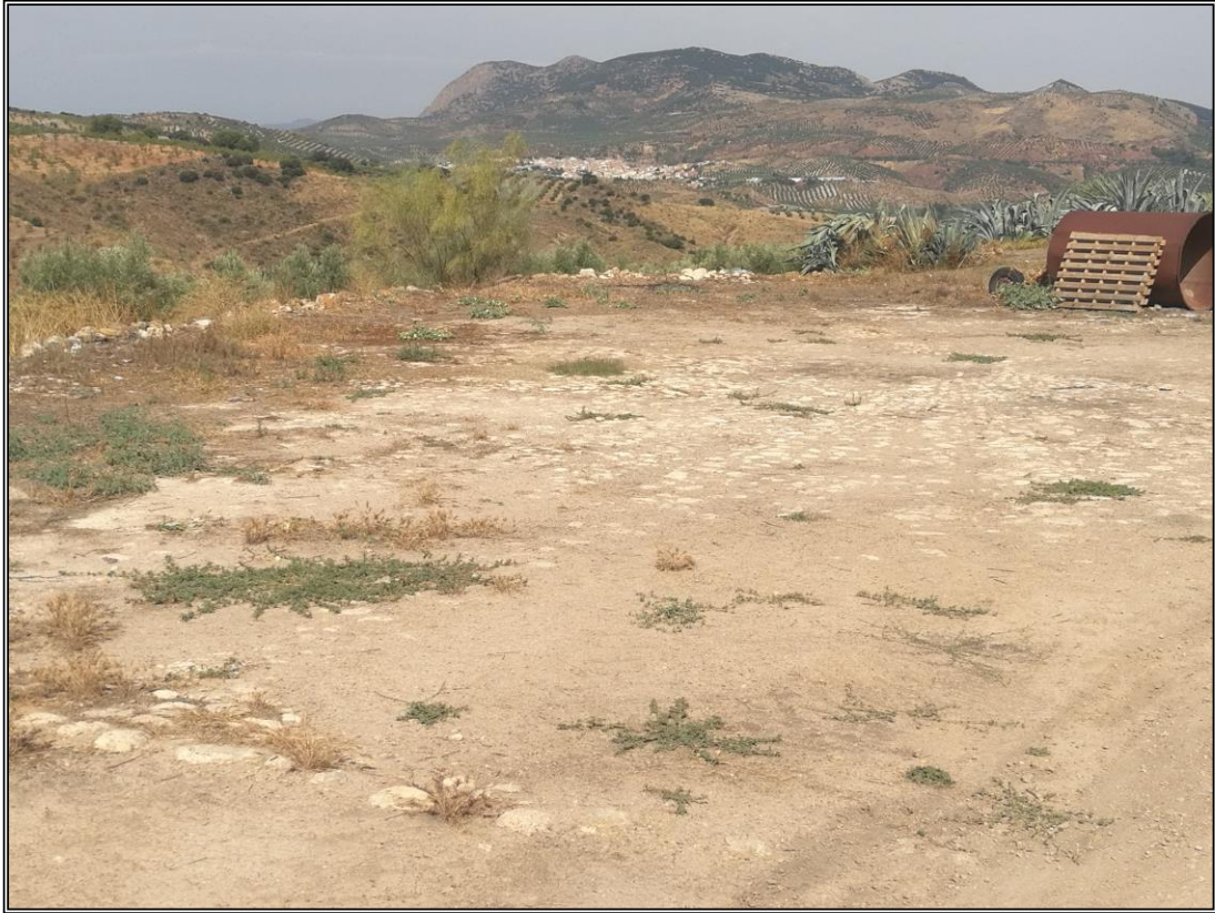
Era 3. Vista parcial de la era. Detalle del empedrado con estructura en forma de estrella.