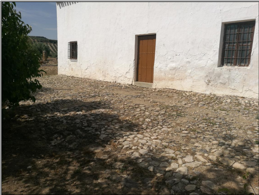
Patín 1. Vista general del patín realizado en la fachada del cortijo.