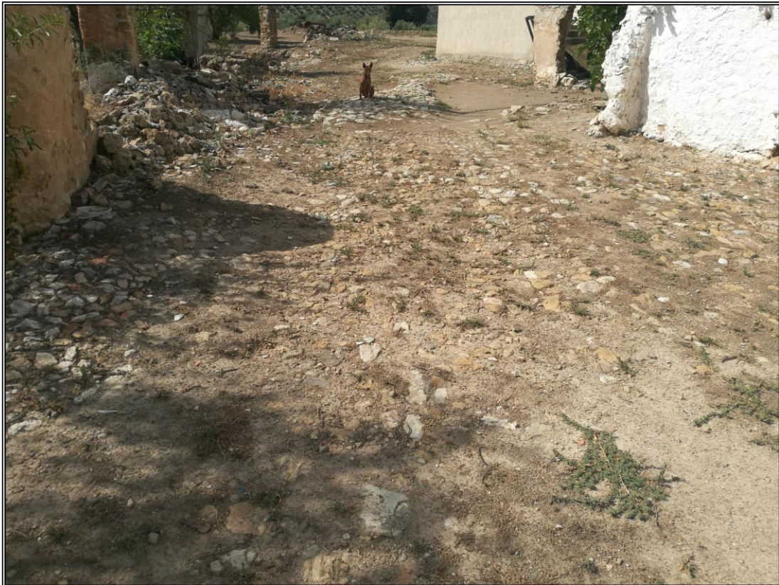
Patín 2. Vista del estado actual del patín. Detalle del empedrado.