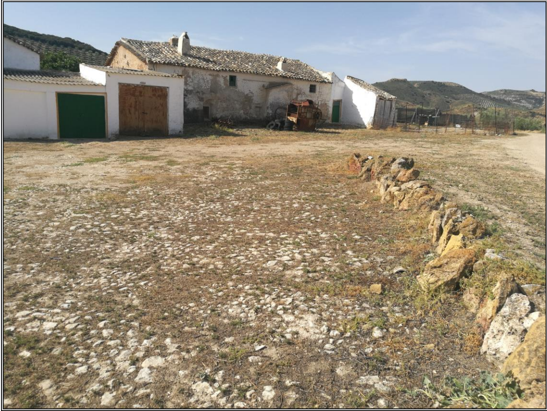
Era 1. Vista del lateral Norte. Detalle del borde fijado con piedras de tamaño mediano-grande.