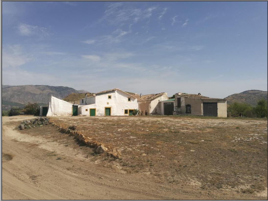
Era 2. Vista del lateral Oeste. Detalle del borde fijado con una hilera de piedras de tamaño mediano-grande.