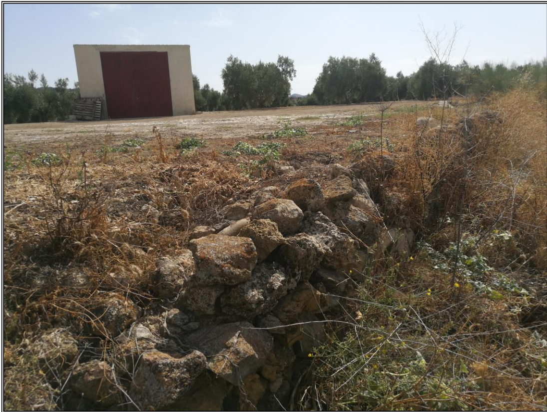
Era 3. Detalle del borde Oeste. Fijado con mampostería de piedra seca.