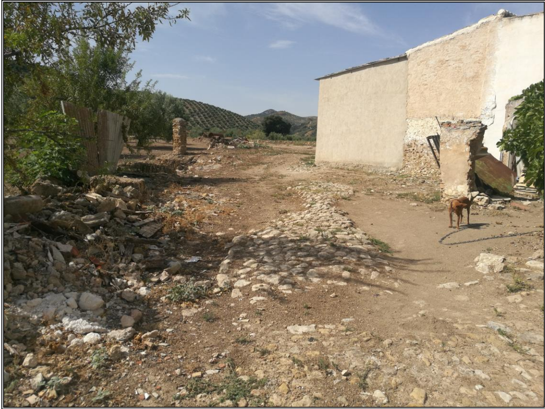
Camino. Vista con orientación Sur del camino empedrado..