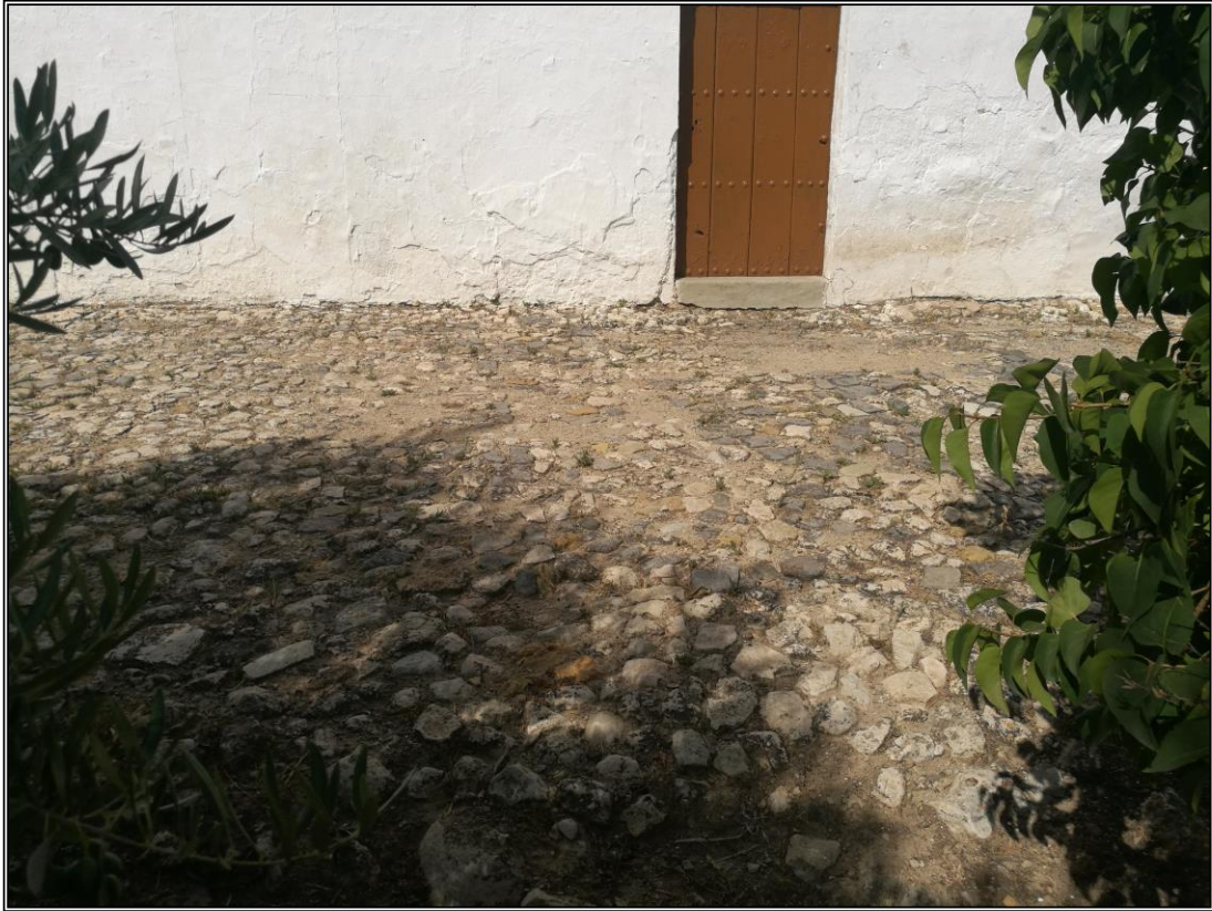
Patín 1. Detalle del empedrado.