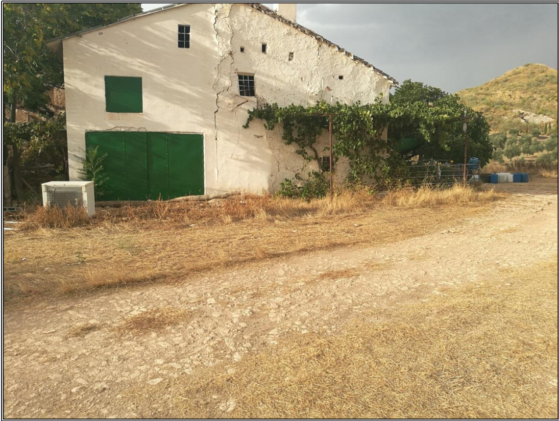
Vista del lado Oeste de la era.