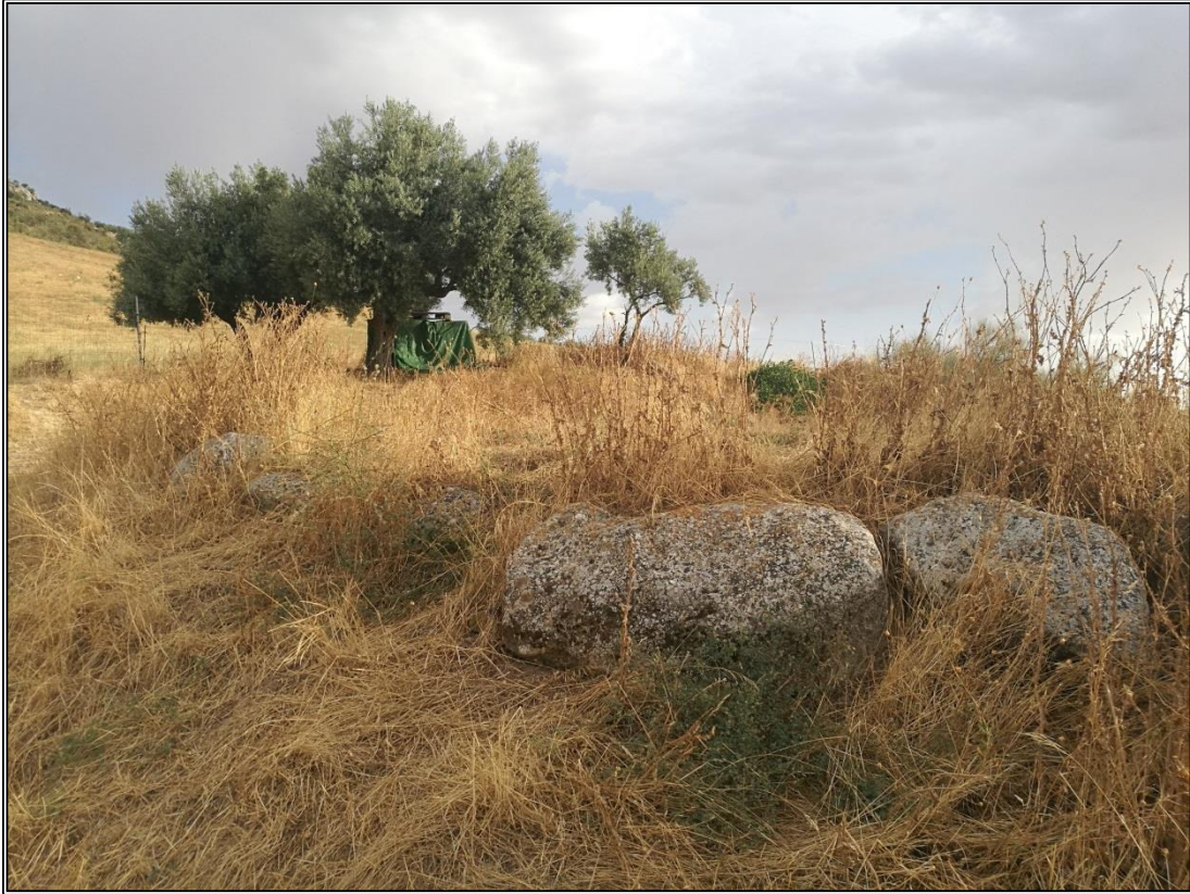
Detalle del borde de la era ubicada al Este del cortijo, estabilizado con grandes bloques de caliza.