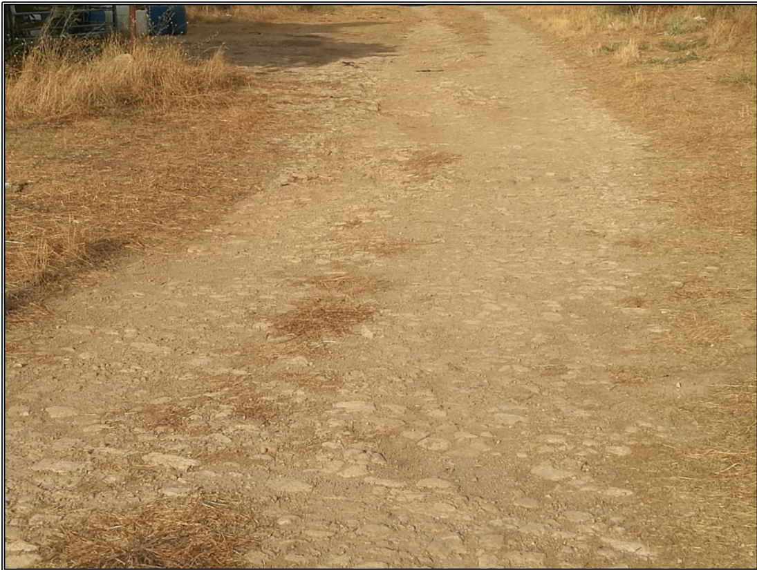
Detalle del empedrado en el lado Oeste.