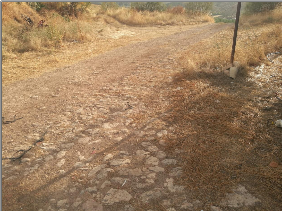
Detalle del empedrado del lado Este de la era.