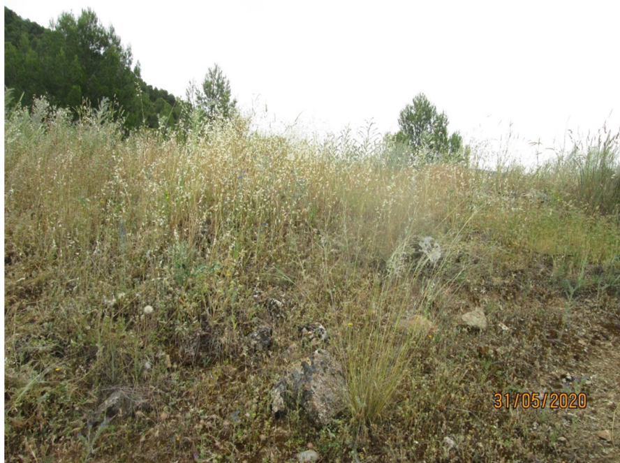
Era nº 34 Cerro Pinar (LINDE) Muro Norte.