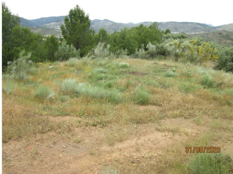
Era nº 34 de Cerro Pinar (LINDE)