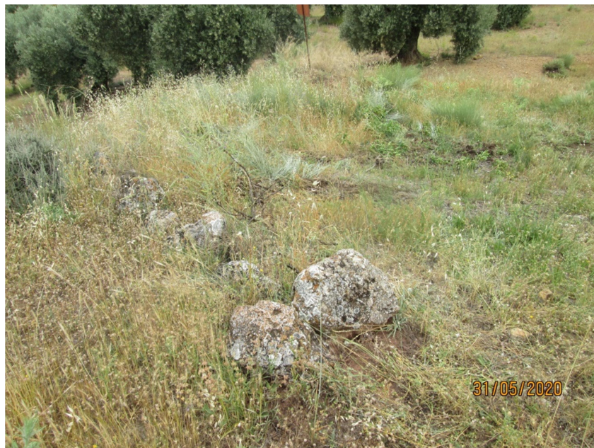
Era nº 34 Cerro Pinar (LINDE)