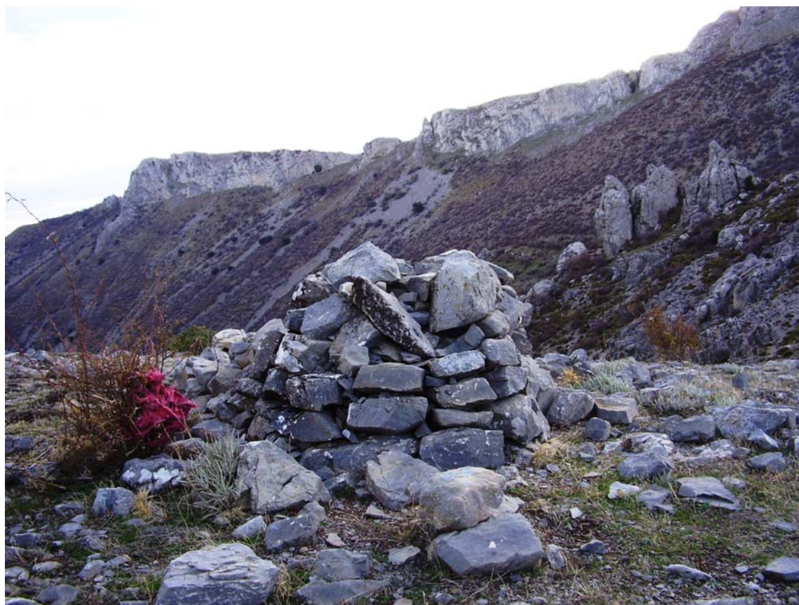
Foto 1. Vista del mojón.

Dato: Ortofoto digital de Andalucía. E= 1:4.000