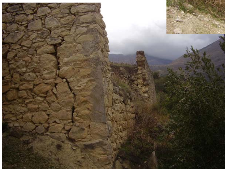
Foto 2. Vista del estado actual de la albarrada de contención.