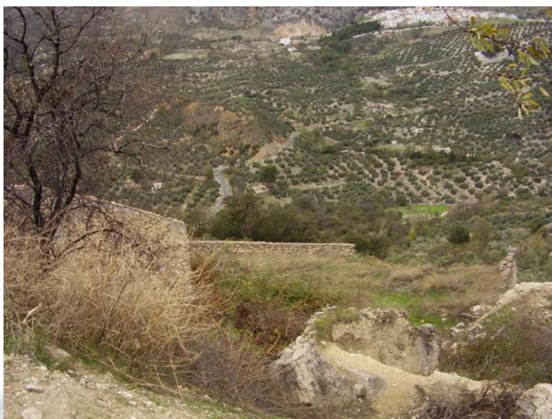
Foto 1. Vista de la era.

Dato: Ortofoto digital de Andalucía. E= 1:2.500