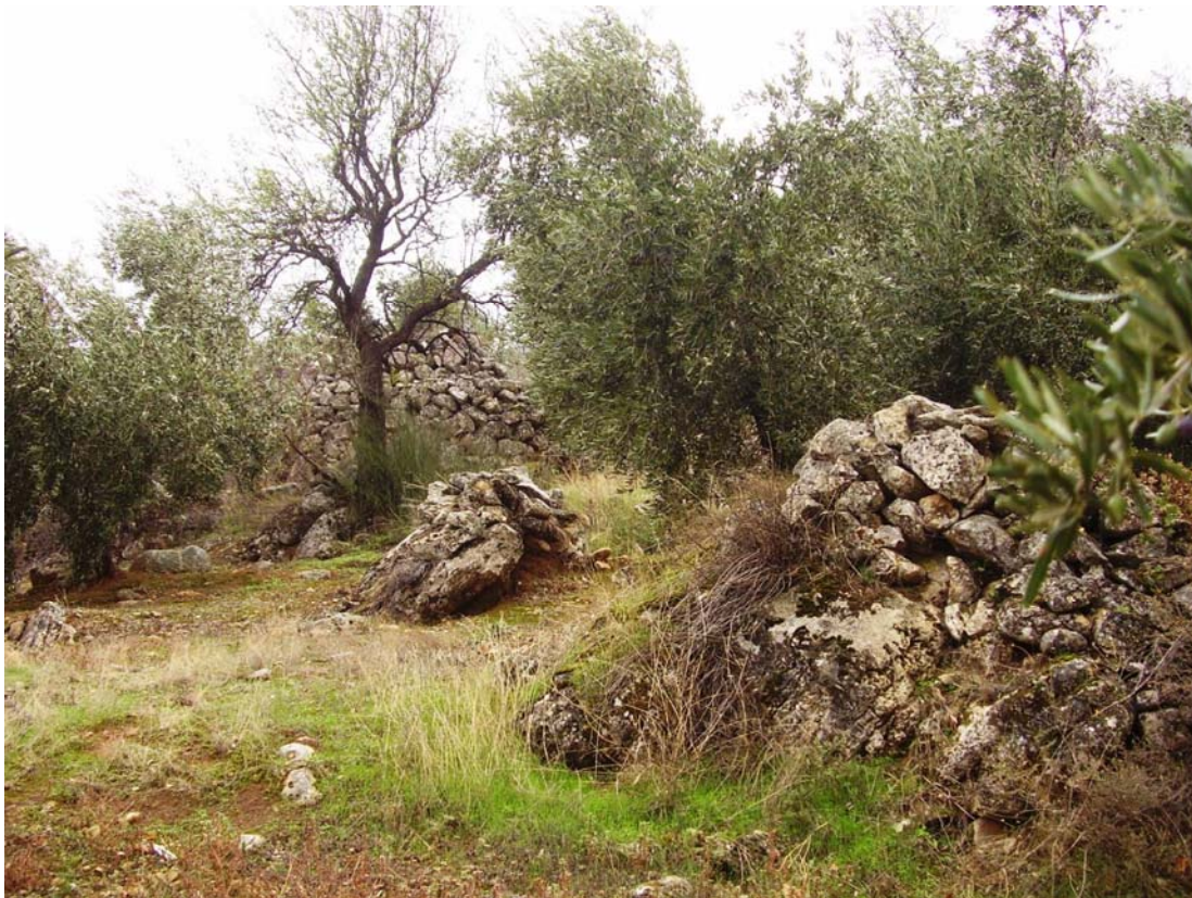
Foto 1. Vista parcial de algunas albarradas.

Dato: Ortofoto digital de Andalucía. E= 1:5.000