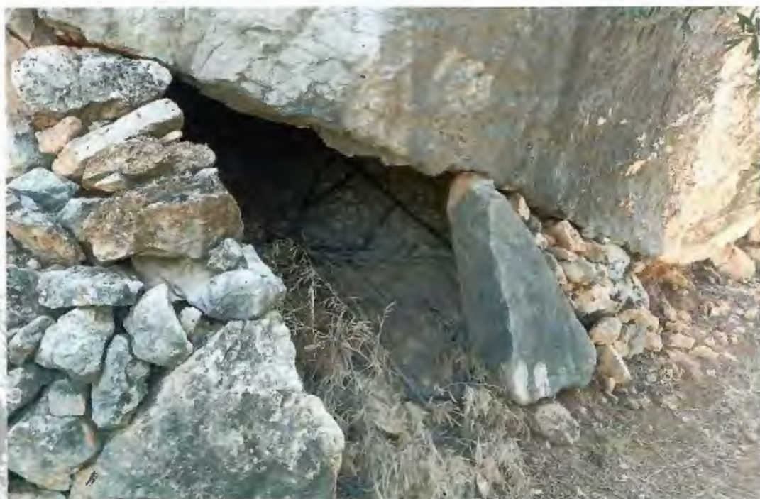
Choza – cueva de Los Peñonares.

Todavía perviven en la zona chozas o cuevas que aprovechan los huecos de estas grandes piedras, cercando sus entradas con muros de piedra seca recogida del entorno (coordenadas UTM X: 441301, Y: 4176489, datum ETRS89, huso 30), Fueron refugios temporales de agricultores, construidos con una técnica que ya era utilizada en el Neolítico. También, algún pequeño corral de ganado.