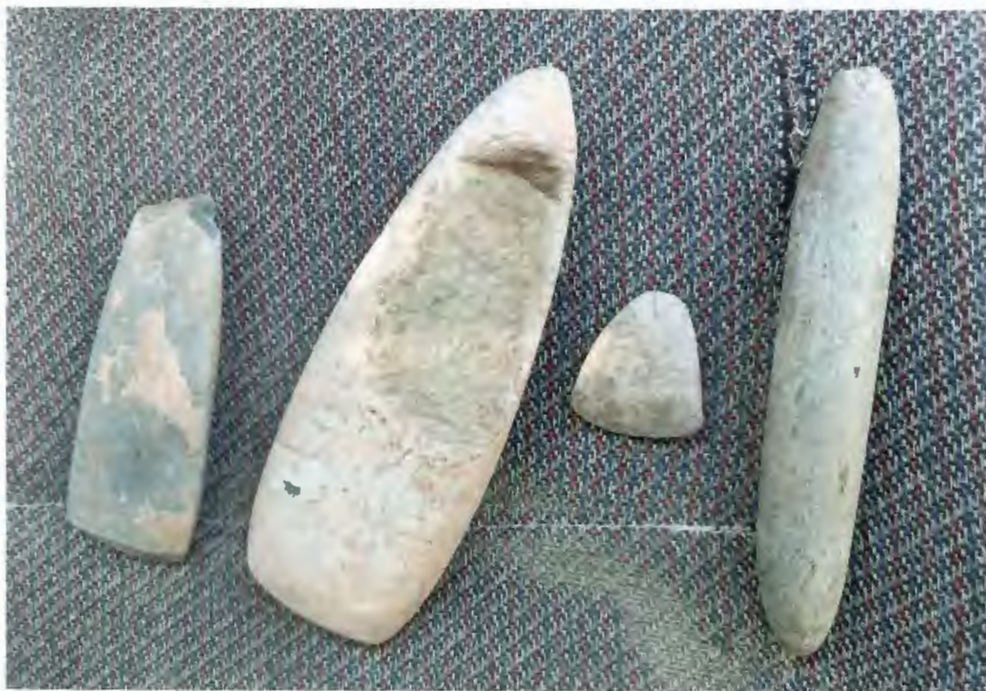
Hachas de piedra halladas en Los Peñonares.